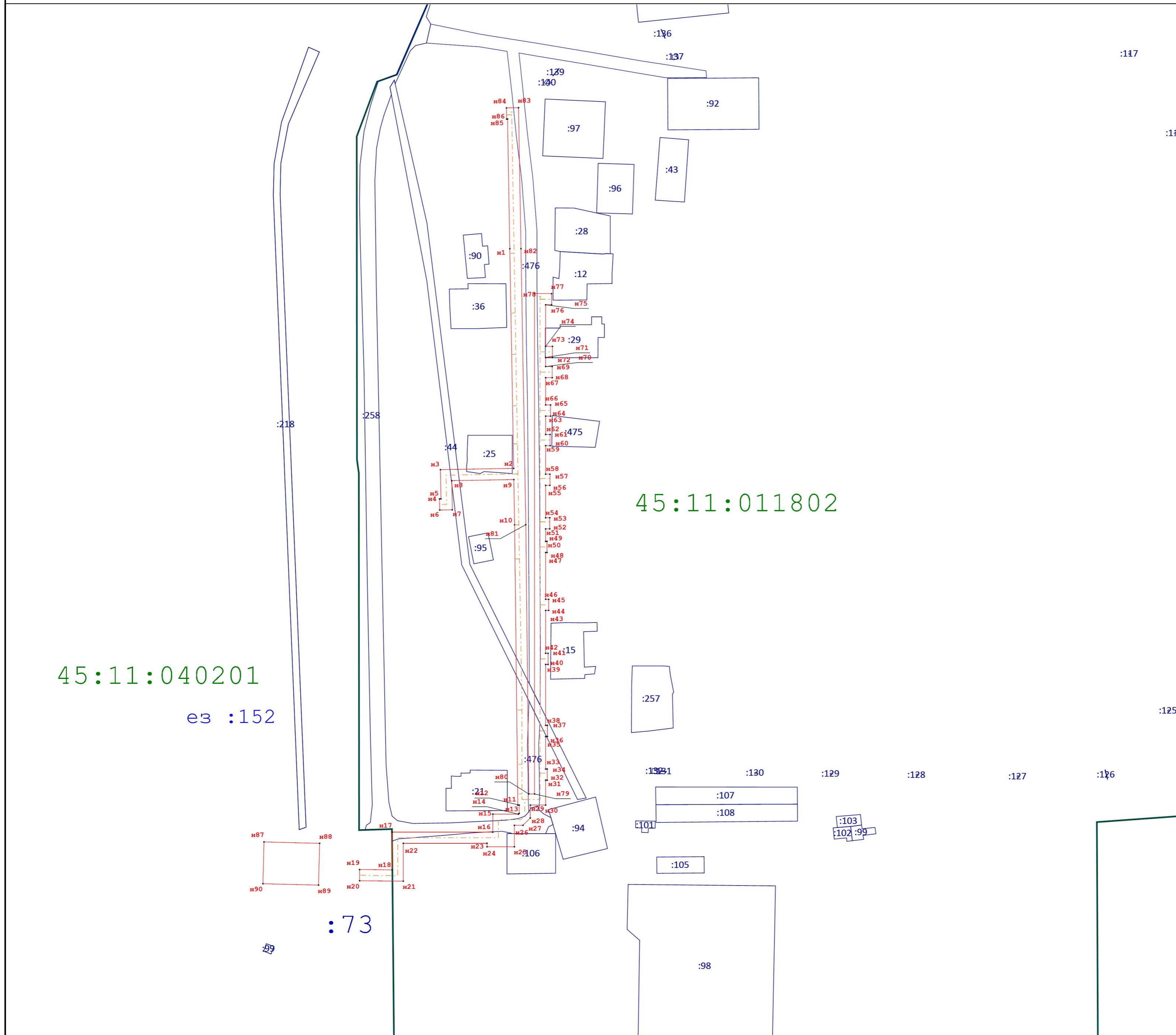
Схема границ публичного сервитута на кадастровом плане территории

Утверждена (наименование документа об утверждении, включая наименования органов государственной власти или местного самоуправления, принявших решение об утверждении схемы или подписавших соглашение о перераспределении земельных участков от _____ № _____